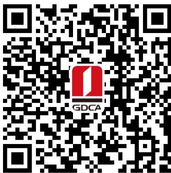
赣州市住房公积金管理中心 数字证书业务申请二维码