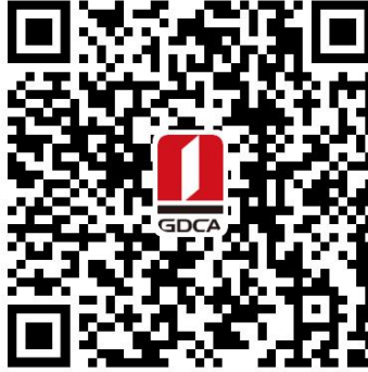
赣州市住房公积金管理中心 数字证书业务申请二维码